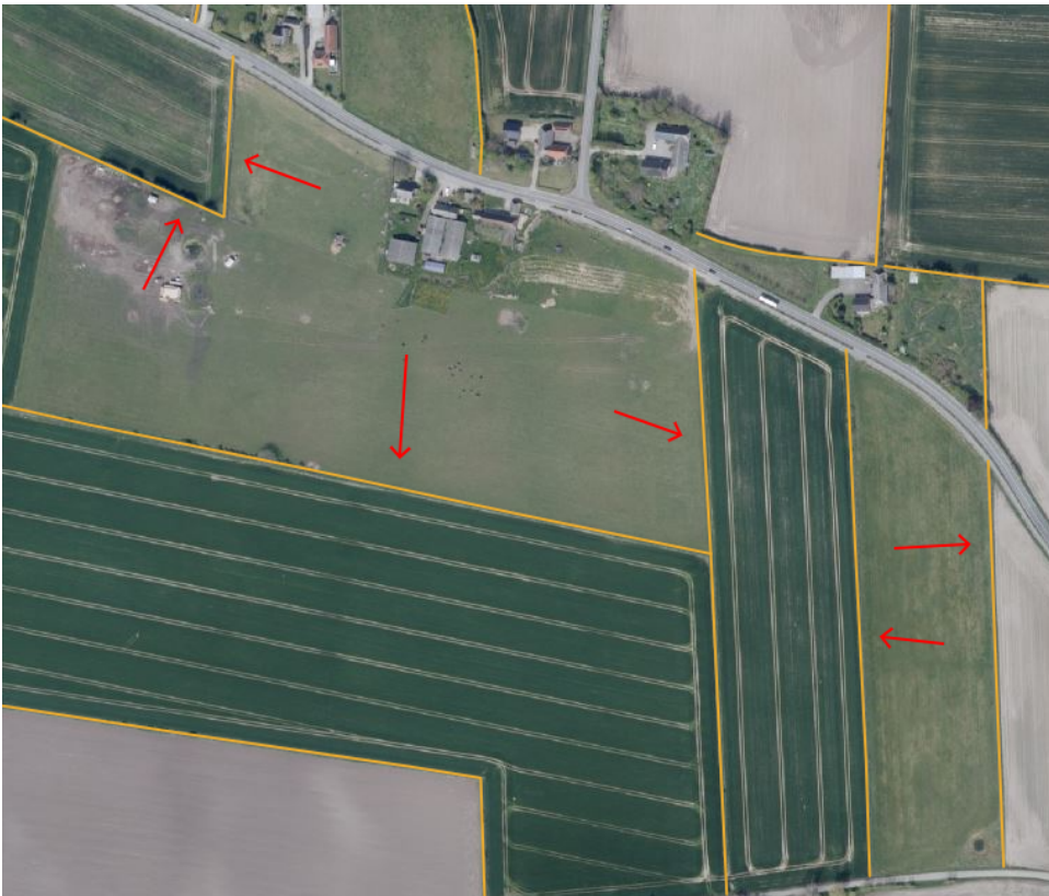
Figur 6. Oversigt over beskyttede diger på matr. 5e og 29a Dunkær By, Rise.

Gule streger og røde pile angiver de beskyttede diger.