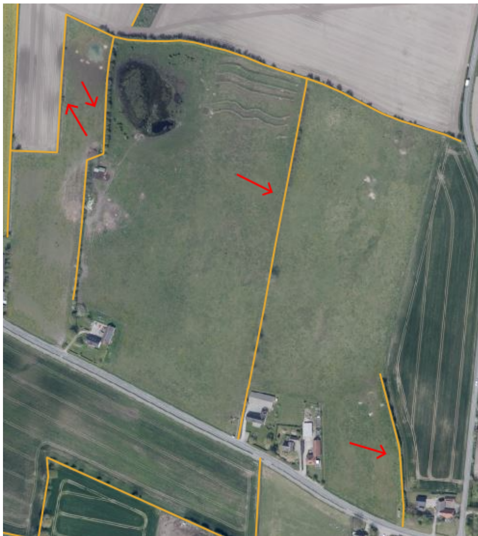
Figur 5. Oversigt over beskyttede diger på matr. 38b, 26a og 3f Dunkær By, Rise.

Der skal holdes afstand til de beskyttede diger angivet på kortene i figur 4 og 5, ligesom der ikke må lægges opgravet materiale på disse.