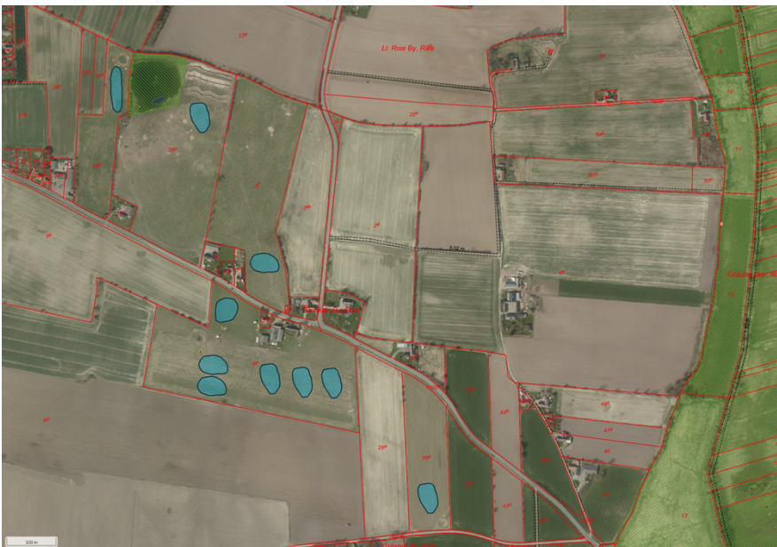
Figur 1. Oversigt over placering af de ønskede søer op matr. 3f, 5e, 26a, 29a og 38b Dunkær By, Rise.

Søerne placeres på landbrugsarealer som anvendes til afgræsning inden for områderne indtegnet med turkis i figur 1: