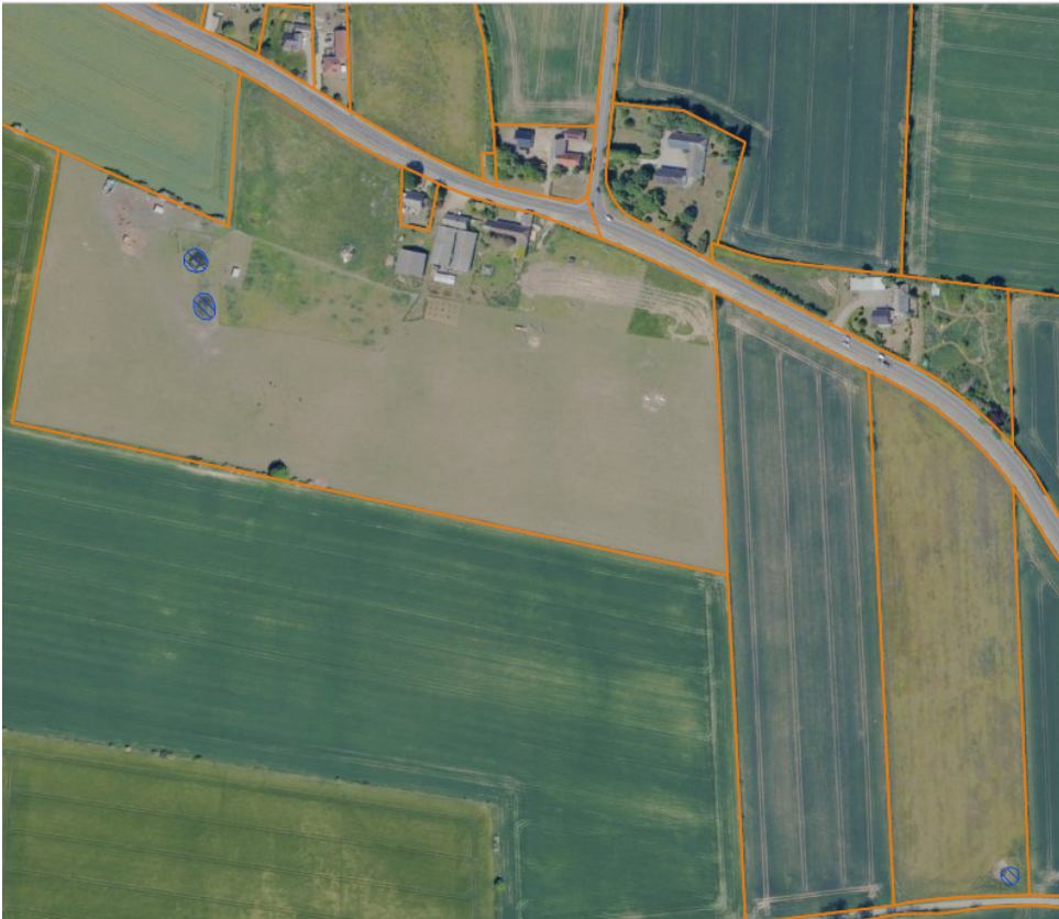
Figur 3. Oversigt over beskyttede naturtyper på matr. 5e, 29a og 3f.