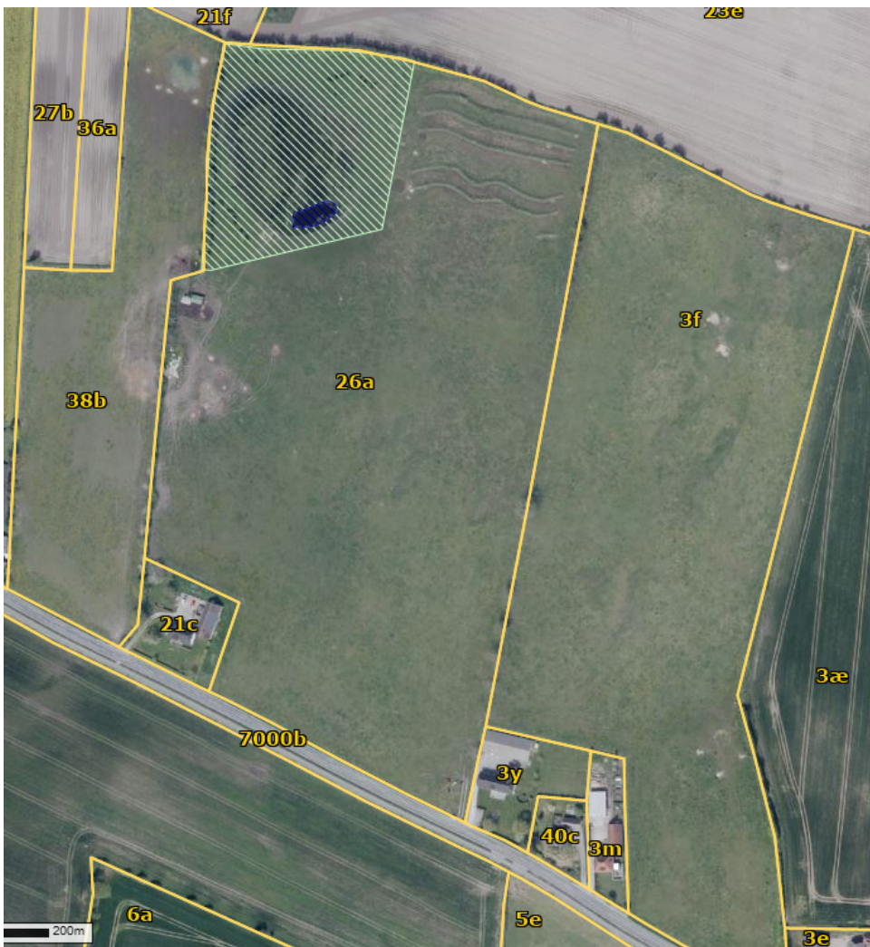
Figur 2. Oversigt over beskyttede naturtyper på matr. 38b, 26a og 3f.

Lysegrøn skravering = § 3-eng, blå skravering = § 3-sø.