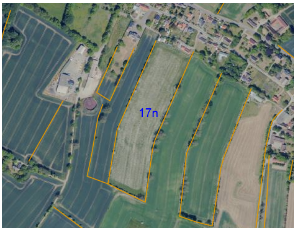
Figur 3. Oversigt over beskyttede diger på matr. 17n Tranderup By, Tranderup. Orange streger = beskyttede sten- og jorddiger.

Der skal holdes afstand til de beskyttede diger (se figur 3 og 4), og der må ikke lægges opgravet materiale på disse.