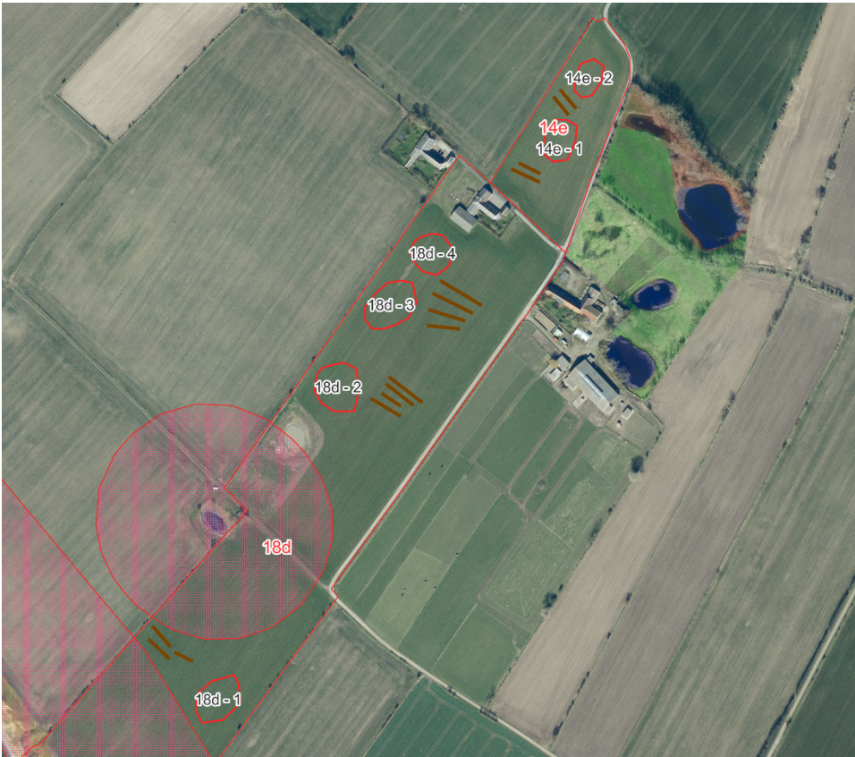
Figur 2. Oversigtskort matr.nr. 14e og 18d Tranderup By, Tranderup. De 6 søer er indtegnet med røde cirkler.

Ærø Kommune meddeler hermed i henhold til Planlovens § 35 stk. 1, tilladelse til etablering af søerne.