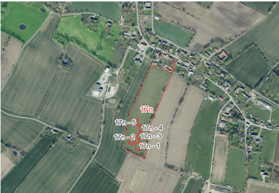
Figur 1. Oversigtskort matr.nr. 17n Tranderup By, Tranderup. De 5 søer er indtegnet med røde cirkler.

Den 25. september 2024 ansøgte Amphi Consult på vegne af jer om landzonetilladelse til etablering af 11 søer på Tranderupmark 4, 5970 Ærøskøbing, matr.nr. 14e, 17n, og 18d. Det største vandhul bliver maksimalt 2.000 m 2 og maksimalt 2 meter dybt. Søerne placeres inden for områderne indtegnet i figur 1 og 2. Den nærmeste nabo ligger ca. 80 meter fra den nærmeste sø.