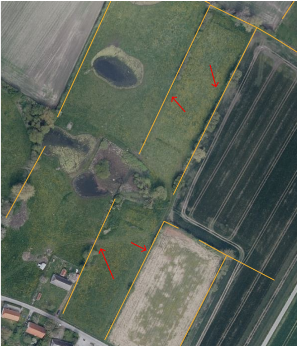
Figur 6. Oversigt over beskyttede diger på matr.nr. 18b Voderup By, Tranderup.

Gule streger og røde pile markerer de beskyttede diger.