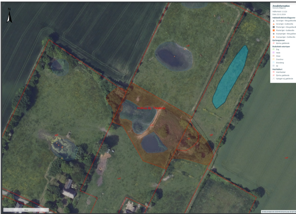
Figur 3. Oversigt over matr. 18b Voderup By, Tranderup.

Turkis skravering markerer den ansøgte søs placering.