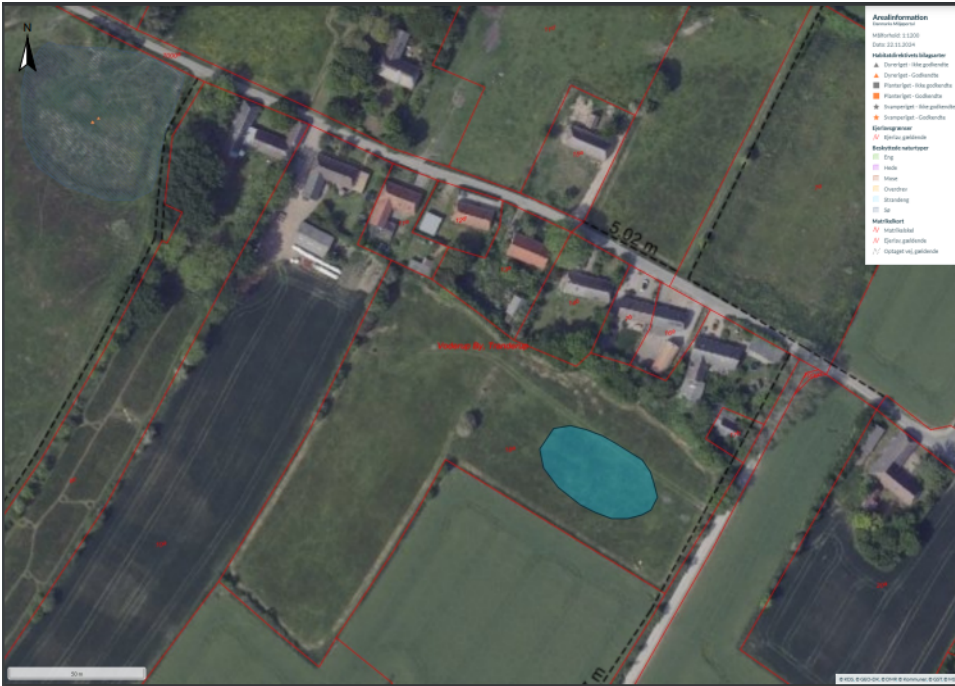
Figur 2. Oversigt over matr. 18a Voderup By, Tranderup.

Turkis skravering markerer den ansøgte søs placering.