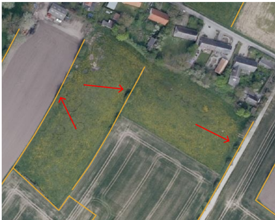
Figur 5. Oversigt over beskyttede diger på matr.nr. 18a Voderup By, Tranderup.

Der skal holdes afstand til de beskyttede diger (se figur 4 og 5), og der må ikke lægges opgravet materiale på disse.